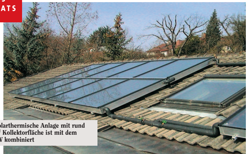
Die solarthermische Anlage mit rund 30 m 2 Kollektorfläche ist mit dem BHKW kombiniert

Dieser Beitrag ist urheberrechtlich geschützt. Ohne Zustimmung des Verlages und der Autoren sind Übersetzungen, Nachdruck – auch von Abbildungen –, Vervielfältigungen auf photomechanischem oder ähnlichem Wege oder im Magnettonverfahren, Vortrag, Funk- und Fernsehsendungen sowie Speicherung in Datenverarbeitungsanlagen – auch auszugsweise – verboten.